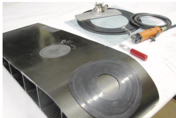
Фото 5: Шаблоны