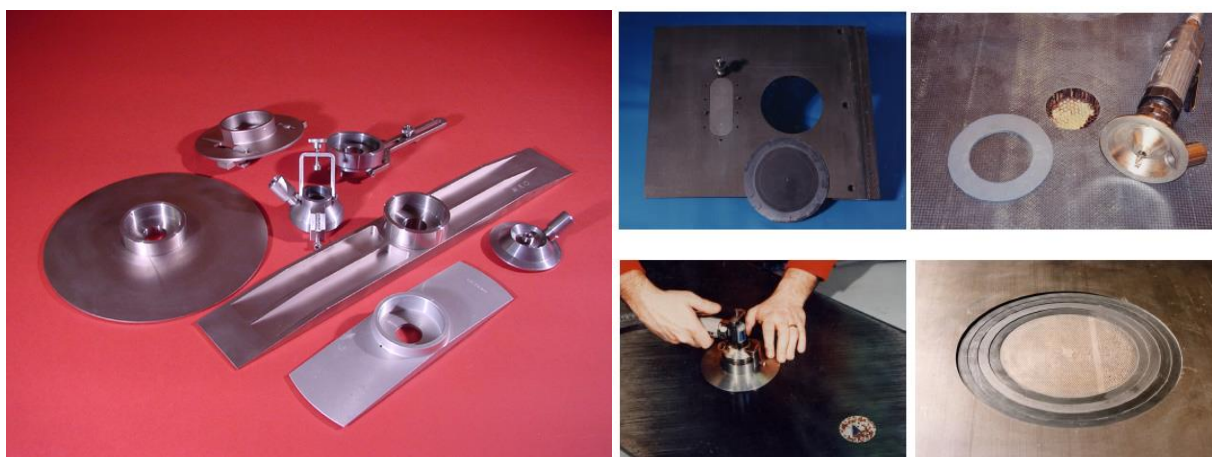
Фото 2: Приспособления для механической обработки поверхности