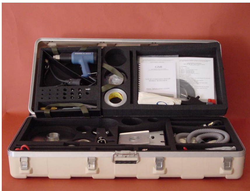
Фото 1: Мобильная мастерская в транспортировочном ящике

Данный набор - результат многолетней работы GMI AERO и опыта, приобретенного в процессе ремонта изделий и ПКМ. Для того чтобы предложить потребителям готовое комплексное решение подготовке перед термокомпрессией, были разработаны специальные резцы, фрезы, шаблоны, которые входят в набор.