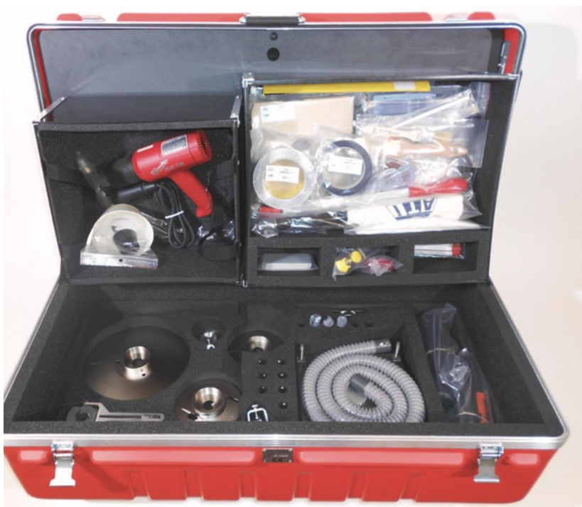
Фото 6: Мобильная мастерская в транспортировочном ящике

Модуль поставляется в специальном ящике на колёсиках, обеспечивающем защиту при транспортировке и хранении, а также мобильность персонала, выполняющего ремонт. Размеры: 1230 x 535 x 285 мм, вес: 30 кг.