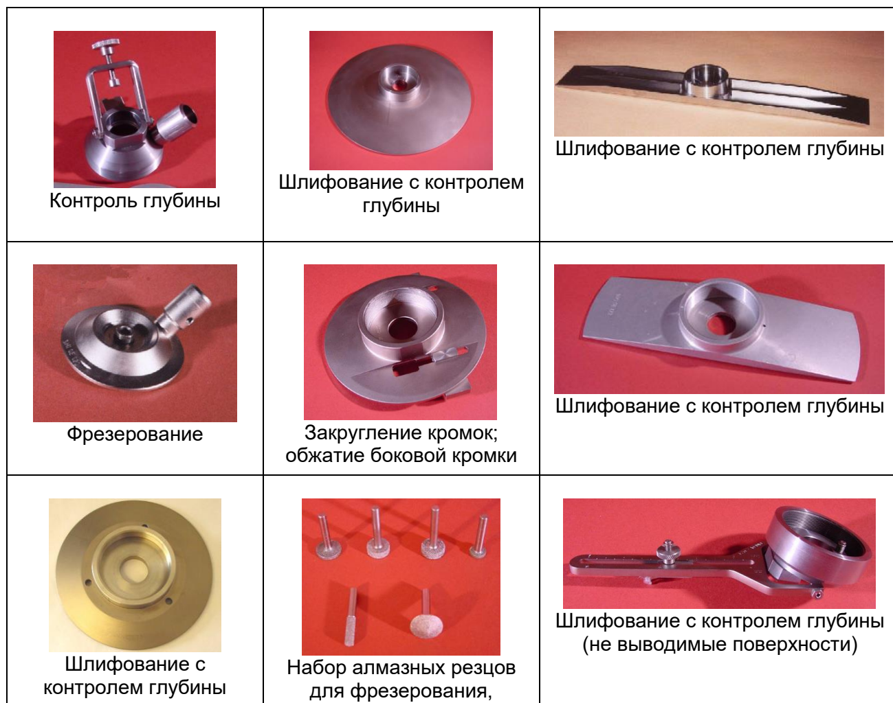
Таблица 1: Приспособления для механической обработки поверхности.